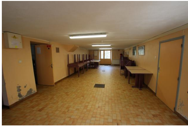
salle de réception